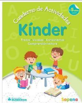
Lenguaje: Cuaderno de actividades Kínder a partir de los 5 años, Sopena.