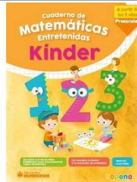
Matemáticas: Cuaderno de matemáticas entrenidas a partir de los 5 años, Sopena.